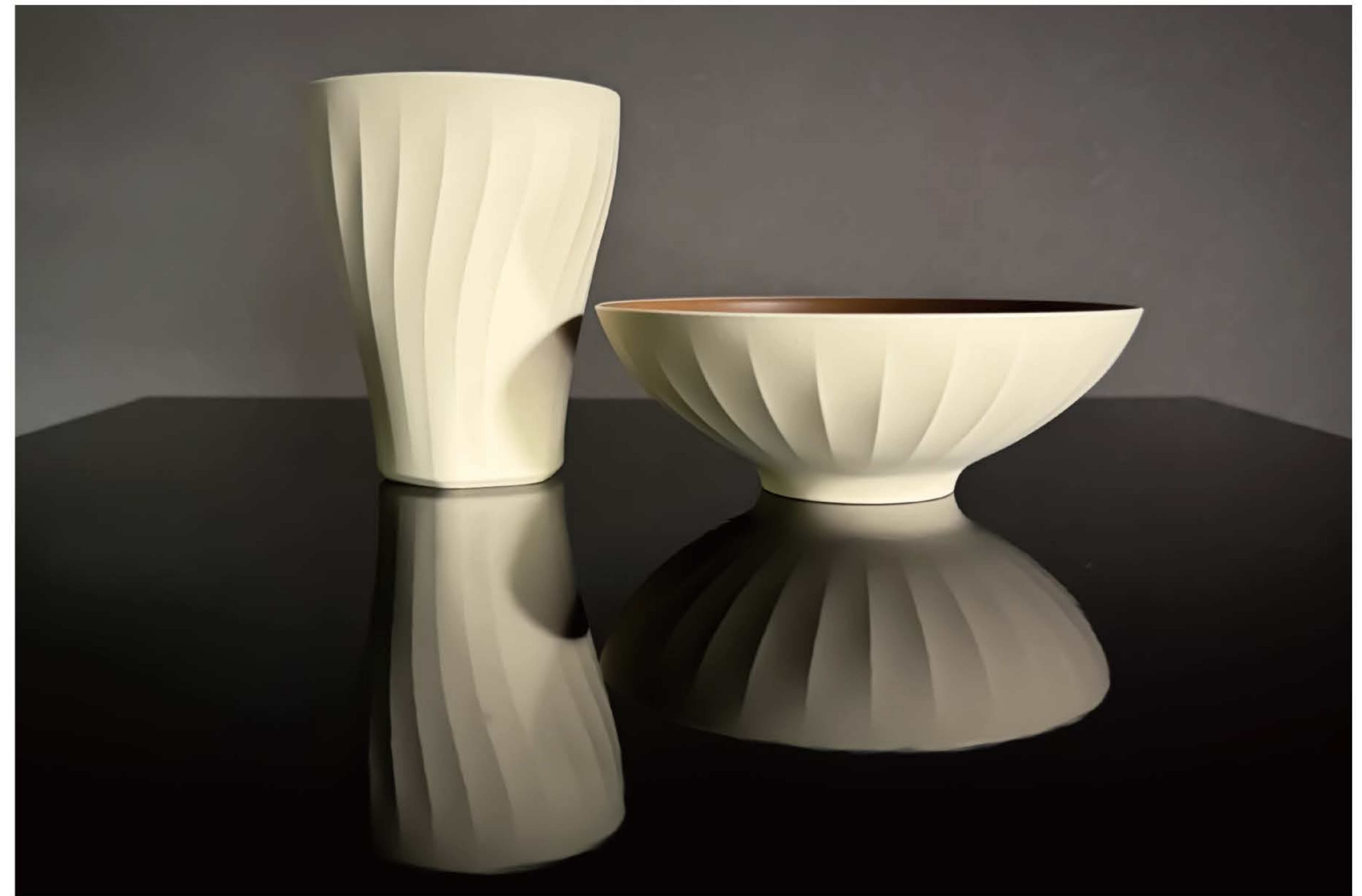
MIRAIWOOD® Tumbler, CHAWAN “EDO - NIHONBASHI”