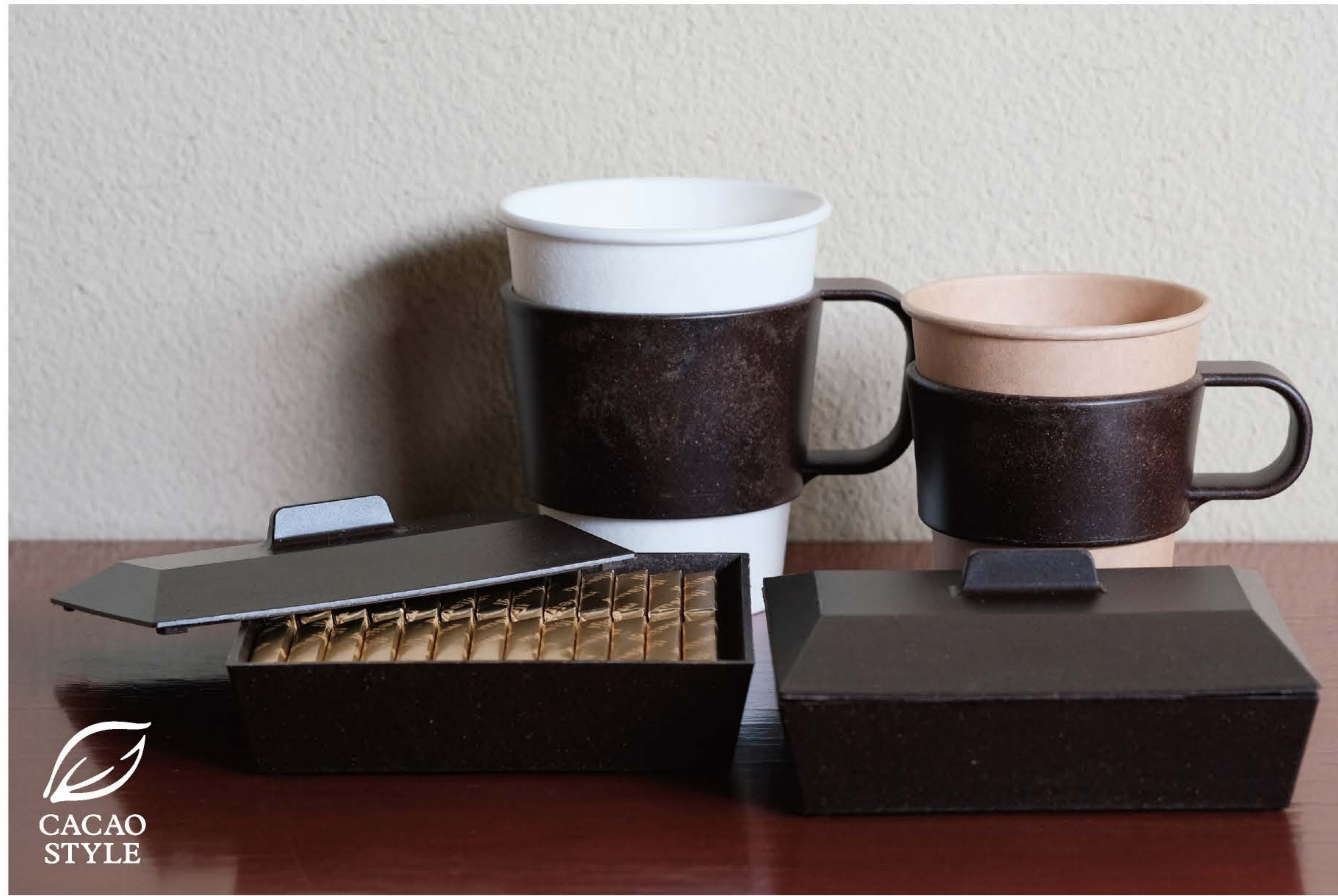
CACAO STYLE Canister, Paper cup holder collaboration with Meiji